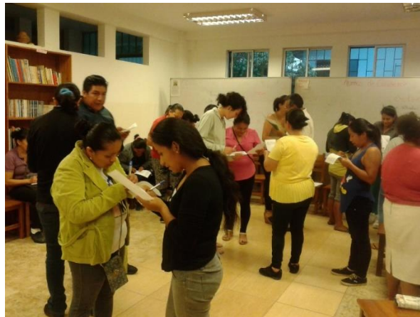
TALLERES CON LOS PADRES DE FAMILIA