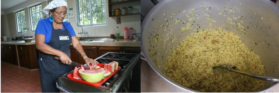
PREPARACIÓN DE ALIMENTOS

Agradecemos el aporte del Ayuntamiento de Avilés-España, Fundación Jóvenes y Desarrollo, e Inspectoría Sagrado Corazón de Jesús-Ecuador, porque con su apoyo, han hecho posible que brindemos herramientas educativas que contribuyen a una mejora en la calidad de vida, presente y futura, de nuestra infancia, adolescencia y juventud en la Amazonía Ecuatoriana.